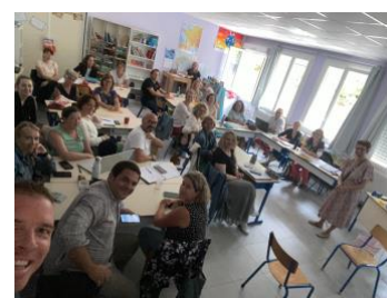
Formation des enseignants Prévention Harcèlement Scolaire