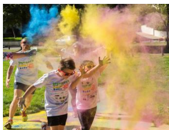
LOGUNECH COLOR RACE 2022