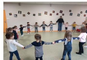
Move and play maternelle