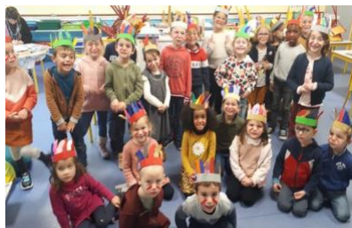
Amérindiens en maternelle