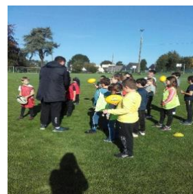
Initiation RUGBY Cycle 3