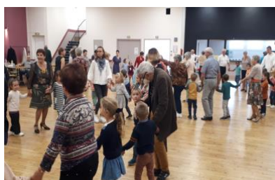
Bal dansant maternelles Semaine Bleue