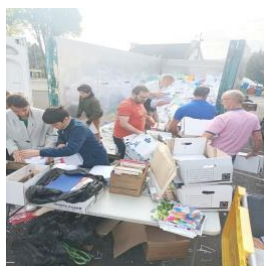
Collecte de papiers