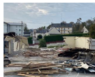
Début des travaux