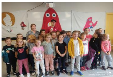
Rencontre Mickaël Guichard, Vice- champion olympique de para- cyclisme