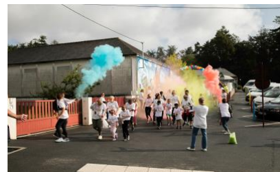
Logonech Color Race