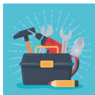
Outils et mise en œuvre pédagogiques :

Nouvelles méthodes de catéchèse à l'école « A la rencontre des Chrétiens » ( CE-CM) et Cadeaux de Dieu (maternelle-CP)